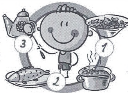
НЕ ПРОПУСКАЙТЕ ПРИЕМЫ ПИЩИ