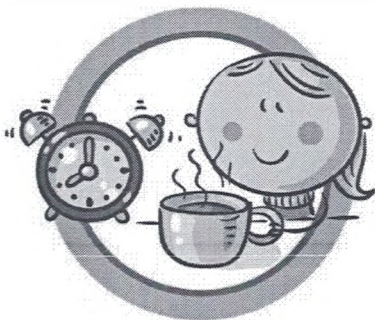
СОБЛЮДАЙТЕ ПРАВИЛЬНЫЙ РЕЖИМ ПИТАНИЯ