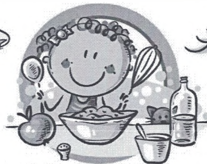
СЛЕДУЙТЕ ПРИНЦИПАМ ЗДОРОВОГО ПИТАНИЯ И ВОСПИТЫВАЙТЕ ПРАВИЛЬНЫЕ ПИЩЕВЫЕ ПРИВЫЧКИ